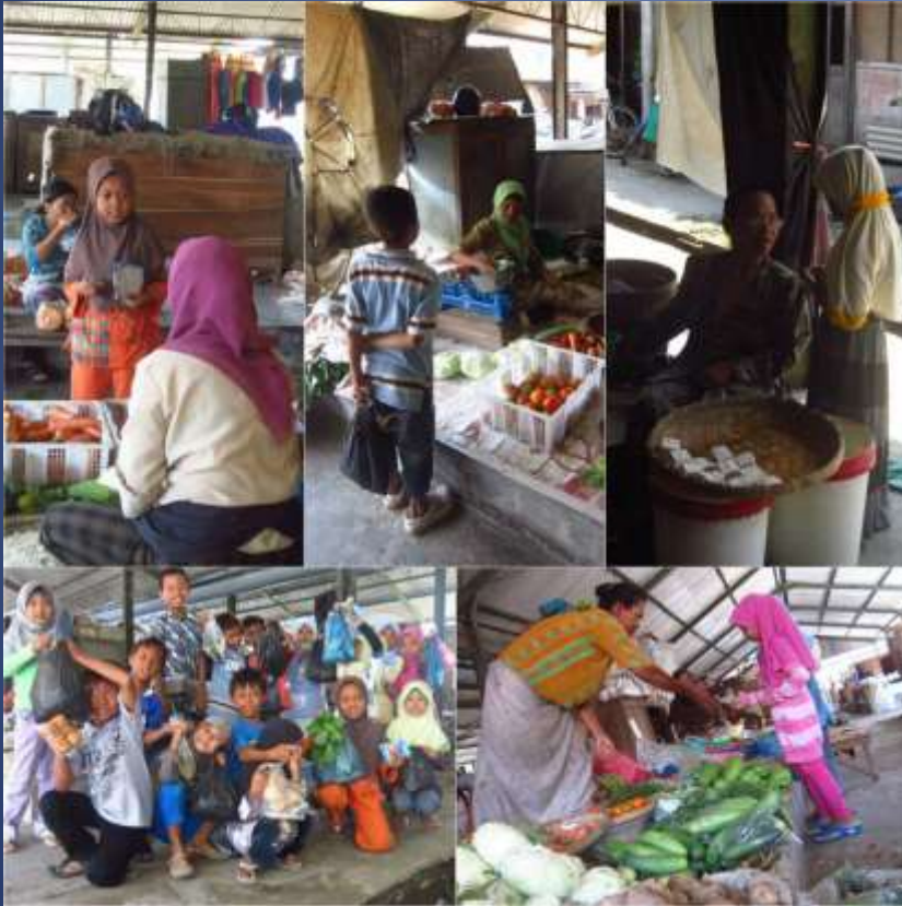
Belanja Di Pasar