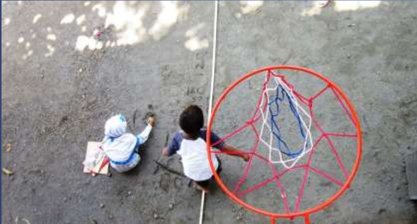
Mengukur tinggi ring basket