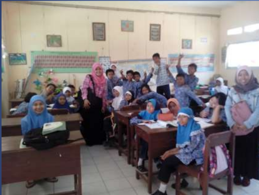
Sesi narsis :D