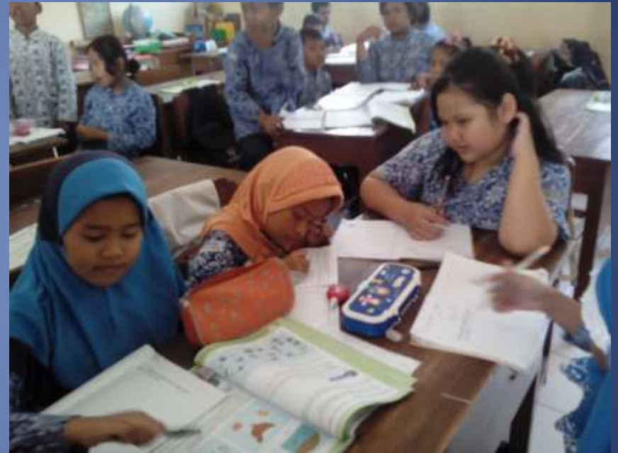
KBM kelas IV