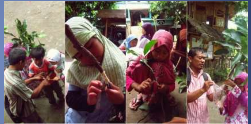
Belajar stek pohon